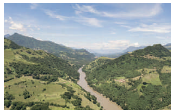
San Gil Santander