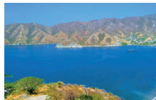
Taganga Santa Marta

*Aplican términos y condiciones dependiendo la temporada